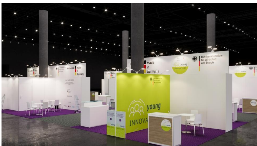
BMW – Gemeinschaftsstand; Foto: Messe Düsseldorf