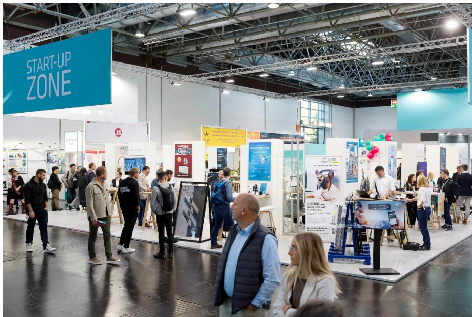
glasstec 2024, Start-up Zone